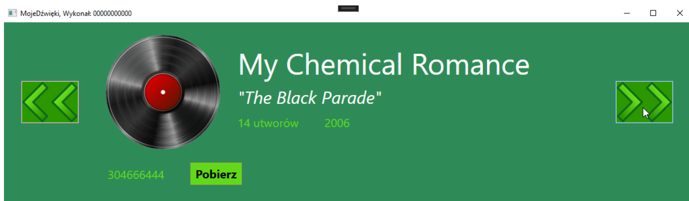
Obraz 3. Po wciśnięciu przycisku z prawej strony

Na obrazie 2 przedstawiono ideę aplikacji desktopowej. W zależności od użytego środowiska programistycznego wygląd może nieznacznie się różnić. Do wykonania zadania można posłużyć się fragmentami aplikacji konsolowej.