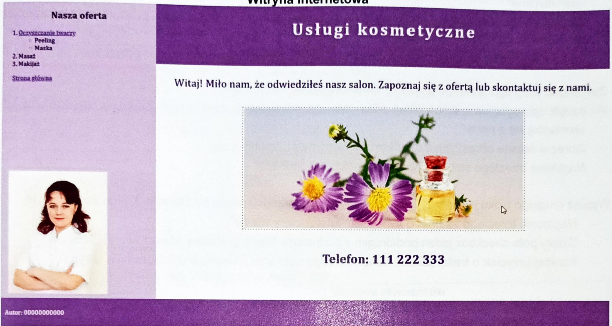
Obraz 2. Strona index.html , kursor znajduje się na obrazie po prawej stronie