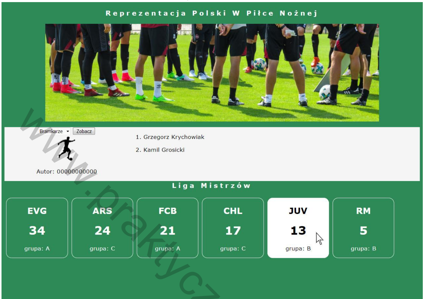
Obraz 2. Witryna internetowa, kursor na piątym bloku informacyjnym, zmienił się kolor tła i czcionki