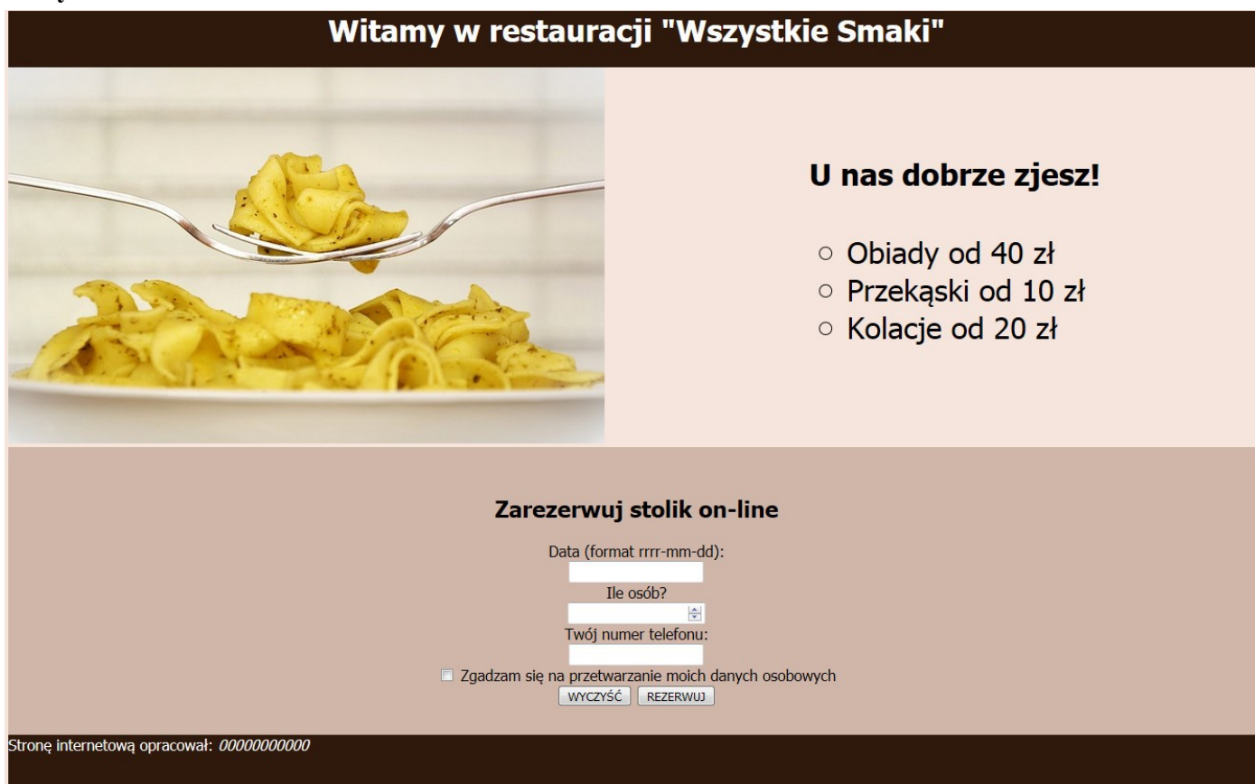
Obraz 2. Witryna internetowa