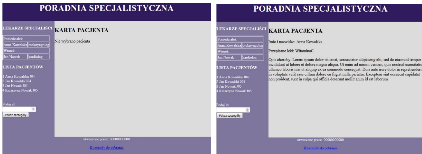
Obraz 2. Witryna internetowa. Strona poradnia.php , pacjent.php